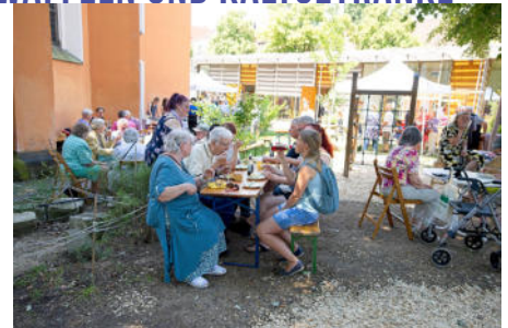
TOMBOLA • TURMFÜHRUNG • LUFTBALLONWETTBEWERB.....